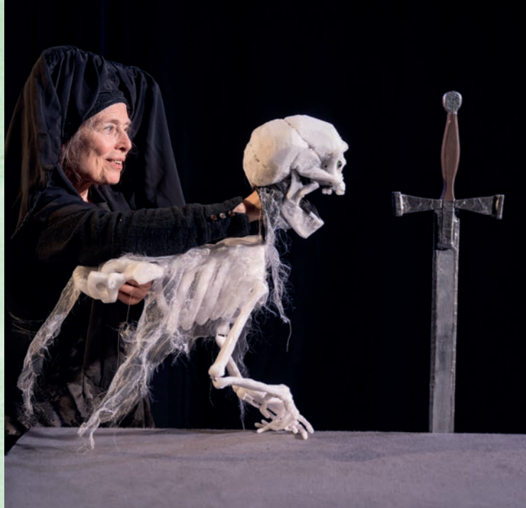
Herzogsglück & Kaiserschmarren | Theater der Nacht