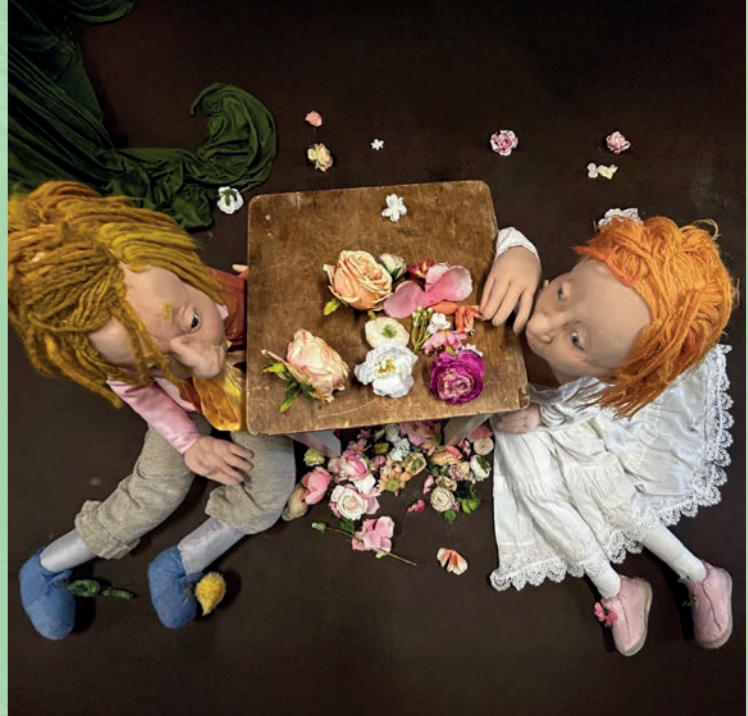
Rapunzel | Theater Allumette