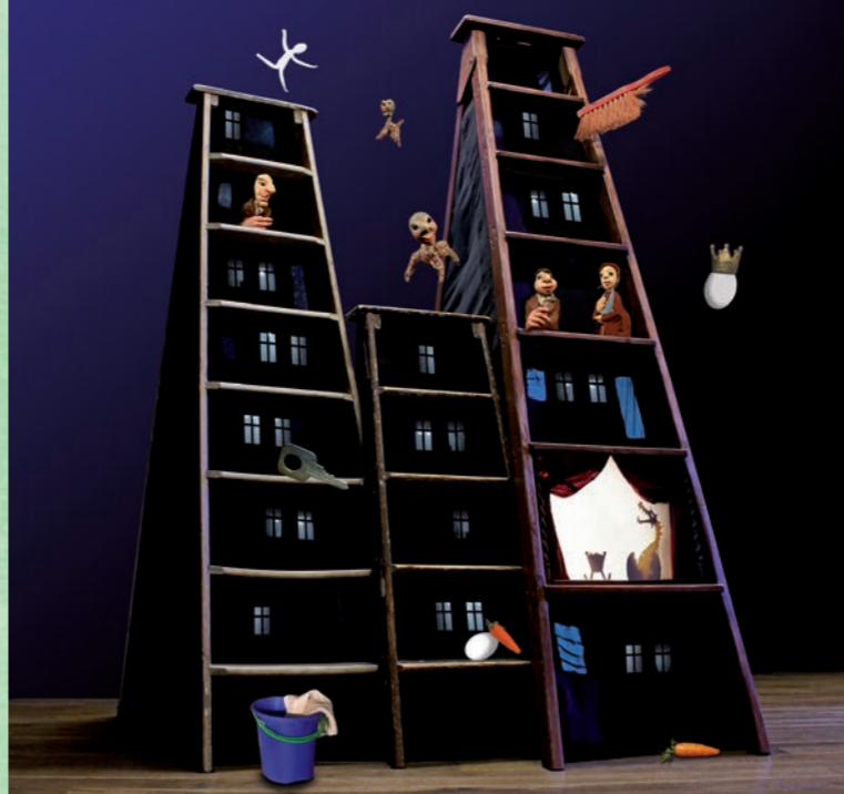
Das Ei | Theater der Nacht