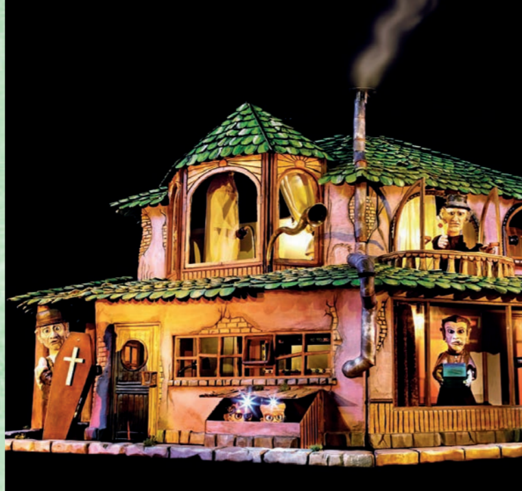
The House | Sofie Krog Teater, Dänemark