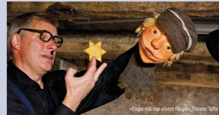
»Engel mit nur einem Flügel«, Theater Töfte

www.theater-der-nacht.de/de/karten-service www.jugendherberge-northeim.de www.northeim-touristik.de