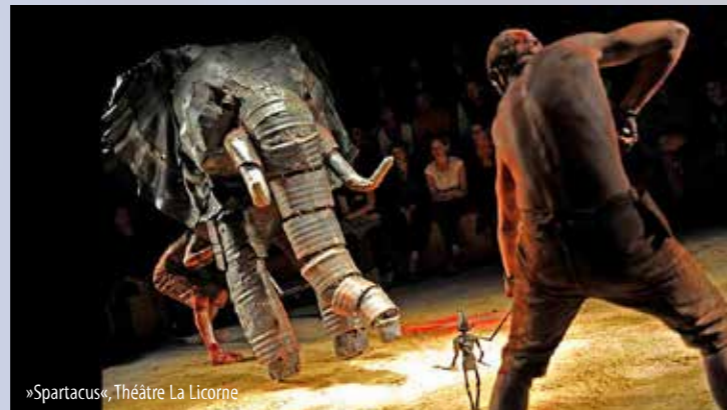
»Spartacus«, Théâtre La Licorne

10–12 Uhr Abschlussrunde, anschl. Theaterfest mit Musik, Puppenspiel etc.